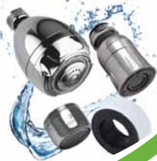
Trousse pomme de douche massage 7 $