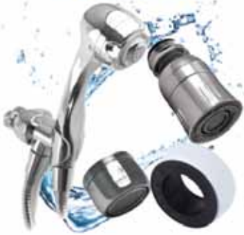
Trousse pomme de douche téléphone 10 $